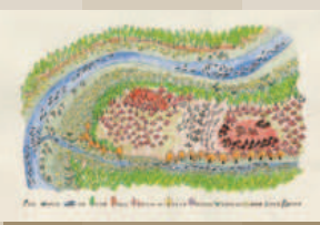
風張1遺跡集落生態系図(辻誠一郎氏作図)