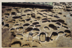
風張1遺跡の土坑墓群(白い丸で囲まれているのがお墓の穴)