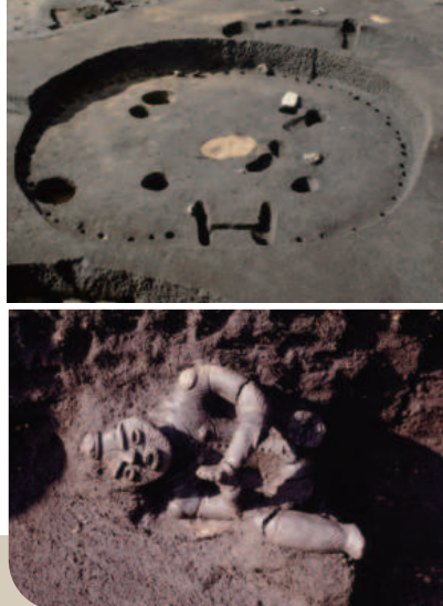
合掌土偶が出土した第15号竪穴住居と合掌土偶出土状況

風張1遺跡から出土した国宝・合掌土偶は、令和6年7月10日で国宝指定から15周年を迎えました。これを記念して、本展覧会では風張1遺跡をはじめとする合掌土偶ができた縄文時代後期の遺跡とその出土品を紹介し、合掌土偶をつくったころの縄文人のくらしの様子について迫ります。