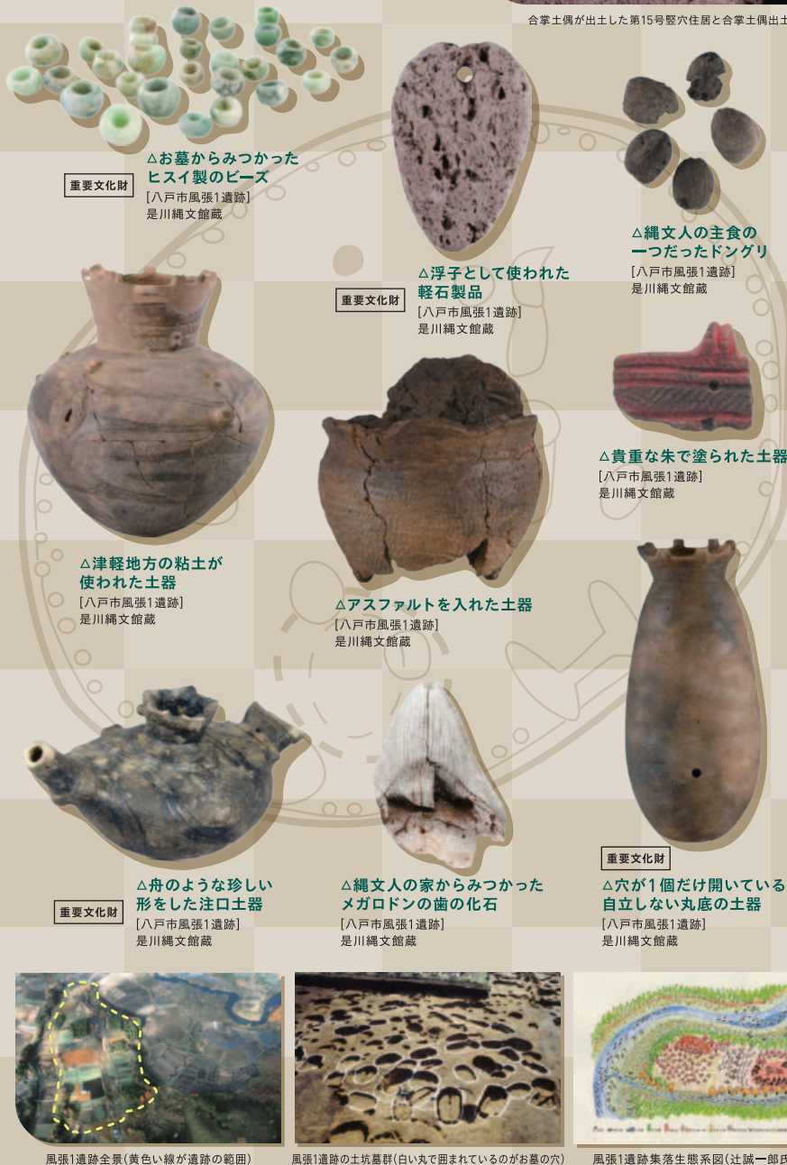
重要文化財 △お墓からみつかった ヒスイ製のビーズ [八戸市風張1遺跡] 是川縄文館蔵